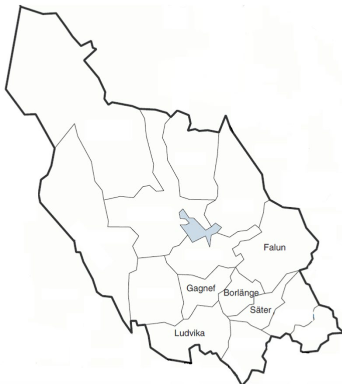
Bild 1. Karta över Dalarnas län och de fem medlemskommunerna i RDM.

Detta dokument utgör ett delprogram för brandförbyggande verksamhet till respektive medlemskommunernas Handlingsprogram för förebyggande verksamhet. Programmet omfattar kommunalförbundet Räddningstjänsten Dala Mitt (RDM) som består av de fem medlemskommunerna Falun, Borlänge, Säter, Gagnef och Ludvika. Se bild 1